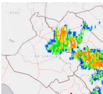
Ảnh Radar phản hồi mây

Hiện nay: Quan sát và theo dõi trên radar thời tiết cho thấy khối mây đối lưu đang phát triển trên khu vực tỉnh Đồng Tháp giáp ranh tỉnh An Giang.